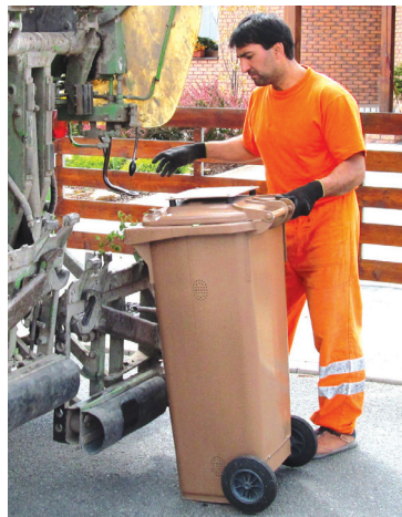
Pracovník technických služeb v Chomutově při svážení bioodpadu.