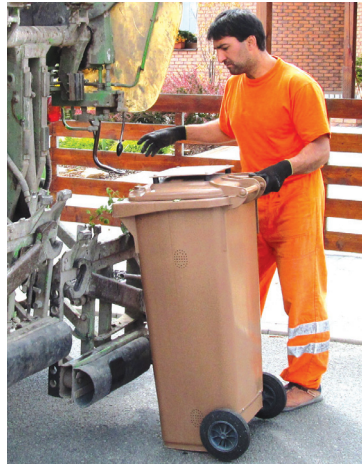
Pracovník technických služeb v Chomutově při svážení bioodpadu.